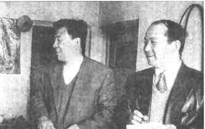
组稿编辑 扈美荣 版式设计 牟玉娟 本版校对 张泉江

近年来，市委、市政府把培养引进人才作为“科教兴市”、“工业强市”的关键工程来抓，自1999年开始先后两次通过公开招考的形式，选拔了71名同志参加培训。现在第一批已经结业，第二批即将结束在中国人民大学的学习。