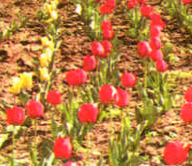
入春以来，我市东西城主要街道及广场处处鲜花烂漫，成为一道亮丽的风景线。春有花，夏有果，秋有果，冬有绿，这是我市广大城区绿化、美化工作者的奋斗目标。今春，这一目标已显现了成果。

图为西城胜利广场小孩子利用星期天在我家用VCD看了两个小时，一无所获。别说了，我看了也感觉方法平平无奇，用卖油翁的话说，手熟而已。计算速度有没有那么神倒在其次，可一张VCD光盘怎么能值一百块钱呢？我的这位亲戚在一家单位干临时工，一个月才赚三百块钱，要维持一家三口的生活，支付孩子的学习费用，可就是因为见别人家的孩子都买光盘，孩子又非常想买，望子成龙心切的她拿出了自己月收入的三分之一，或者说是拿出了一家三口当中一个人一个月的全部生活费用。