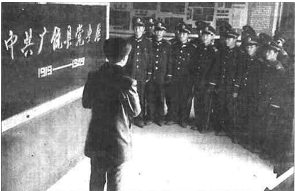
近日,武警广饶县支队组织官兵来到市历史博物馆,认真听取了工作人员关于党的光辉历史的生动解说。